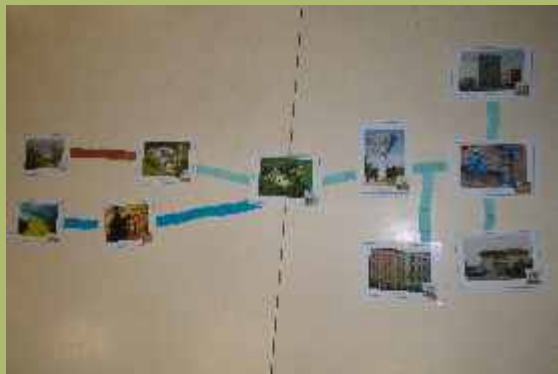
Obr. 3: Model cesty vody