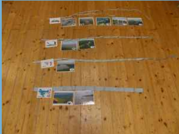
Obr. 1: Skládání názvů a fotek řek