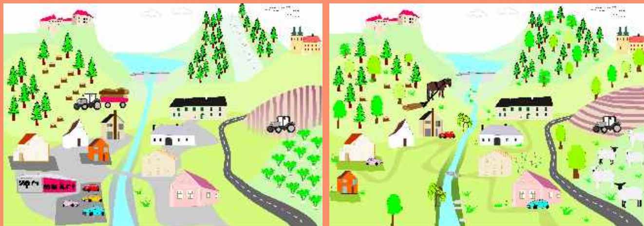
Obr. 5: Vliv člověka na krajinu a povodně